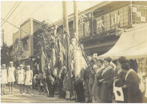
昭和13年リレー大会